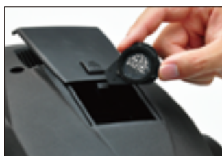
ローテートゴボホイールは交換可能